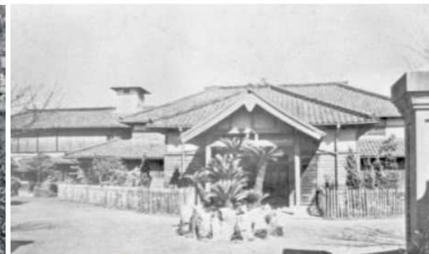
昭和2年 天草公会堂