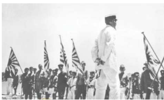
昭和18年頃 海洋少年団訓練