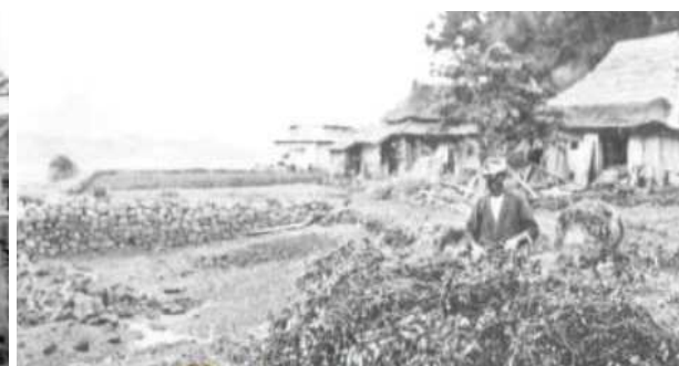
昭和10年 カライモ収穫