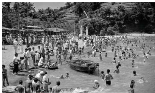
昭和27年 茂木根海水浴場