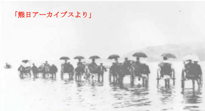
明治40年 本渡港「人力車で乗船」