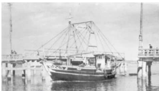
昭和28年 本渡瀬戸の開閉橋