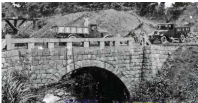
昭和5年 旭炭鉱坑口トラック