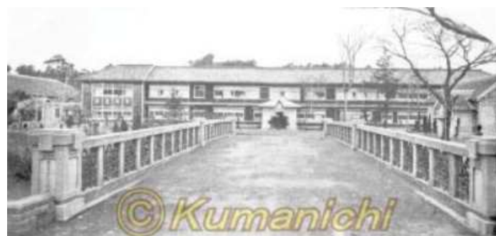
昭和10年 天草中学校正門