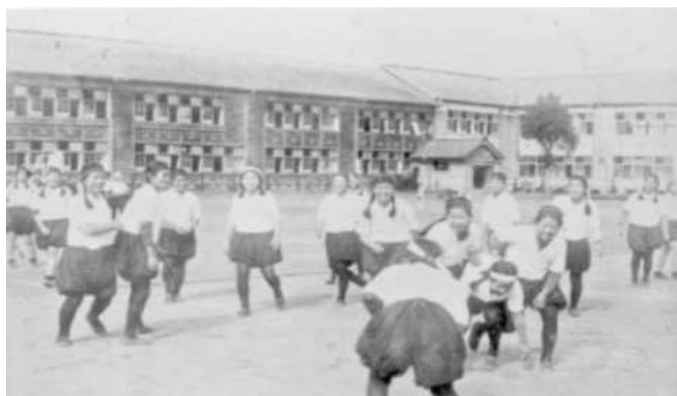
昭和10年頃 本渡高女 体育の授業