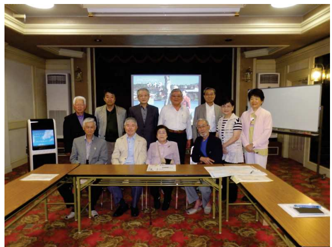
平成27年5月16日~17日「三支部交流会」の様子