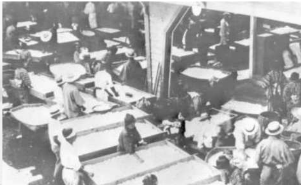
昭和6年 本渡満市場